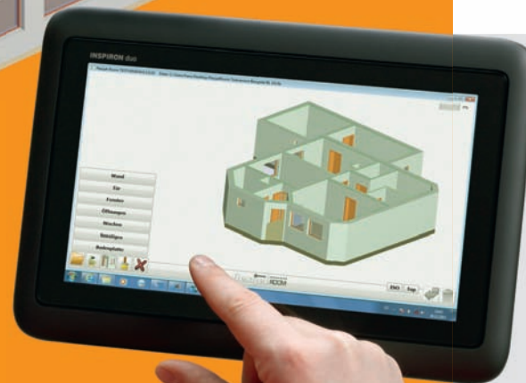
INNOVATION CAD AUFMASS

Die Messung erfolgt ohne Gerüst und Leiter, ohne Möbelrücken oder Geräteabbau. Dabei erfassen wir Distanzen, Bögen, Fenster, Treppen oder Einbauschränke auch im möblierten Raum. Aus den einzelnen Raum-Scans werden die Daten direkt verarbeitet, Grundrisse und Pläne sowie 3D-Modelle entstehen per Computer ohne extra Zeichnungsfertigung. Eine Kontrollmessung ist nicht nötig. Sie sehen sofort ein maßstabsgetreues Gesamtmodell von Räumen und Gebäuden.